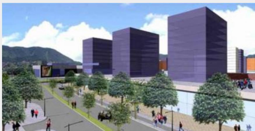
Perfil de la "Ciudad Salud Mercantil" que se está construyendo en los alrededores de la Calle 1ª con 10 dentro del Plan centro en Bogotá.